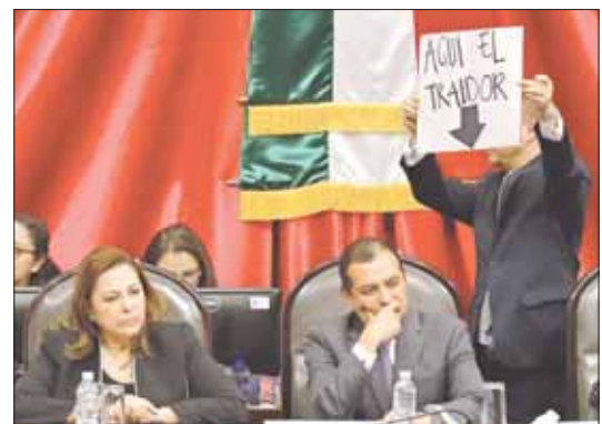
Diputados del blanquiazul impugnan a Ernesto Cordero (en la imagen), quien con apoyo del PRI fue designado presidente del Senado, durante la sesión de apertura del periodo ordinario en San Lázaro