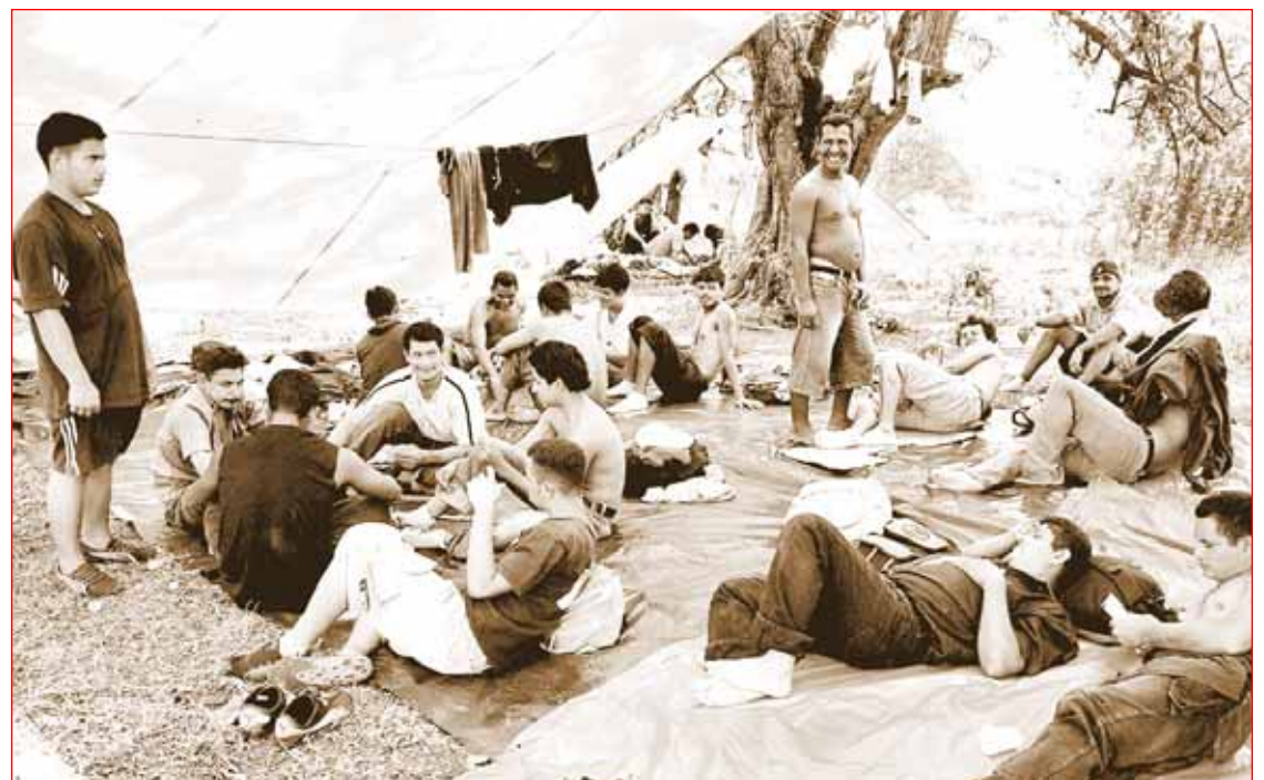
Indocumentados toman un descanso antes de seguir su camino hacia el norte