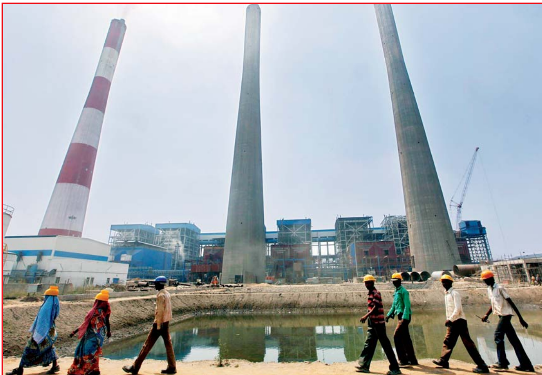
Obreros recorren la planta de la multinacional india Jindal Power and Steel Ltd, en Nisha, en el estado de Orissa, el pasado martes

Impulsada por el crecimiento de su población y el florecimiento de su clase media, India se perfila como un mercado importante para productos latinoamericanos como soya, oleaginosas, aves de corral y