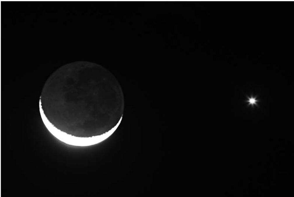
Desde el valle de México fue posible atestiguar anoche la conjunción de la Luna y Venus