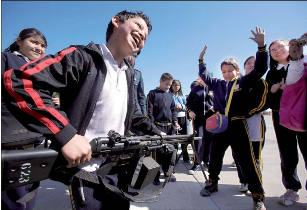
Escolares juegan con armas descargadas durante la celebración del Día del Ejército en la segunda Zona Militar en Tijuana, Baja California

■ “Las fuerzas armadas se desplegarán donde opere el narco ”