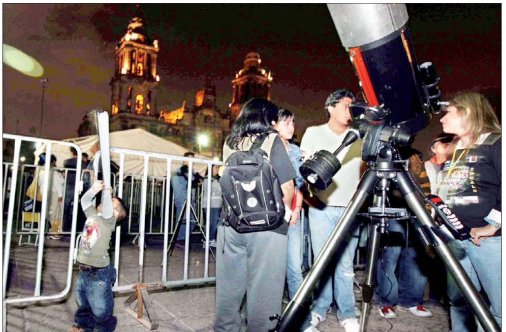
Miles de personas acudieron al Zócalo capitalino para participar en La noche de las estrellas , primer acto con el que se busca acercar al público a la ciencia mediante observaciones con telescopios, y que la UNAM y el IPN quieren repetir cada año LAURA POY Y ÁNGEL BOLAÑOS ■ 33