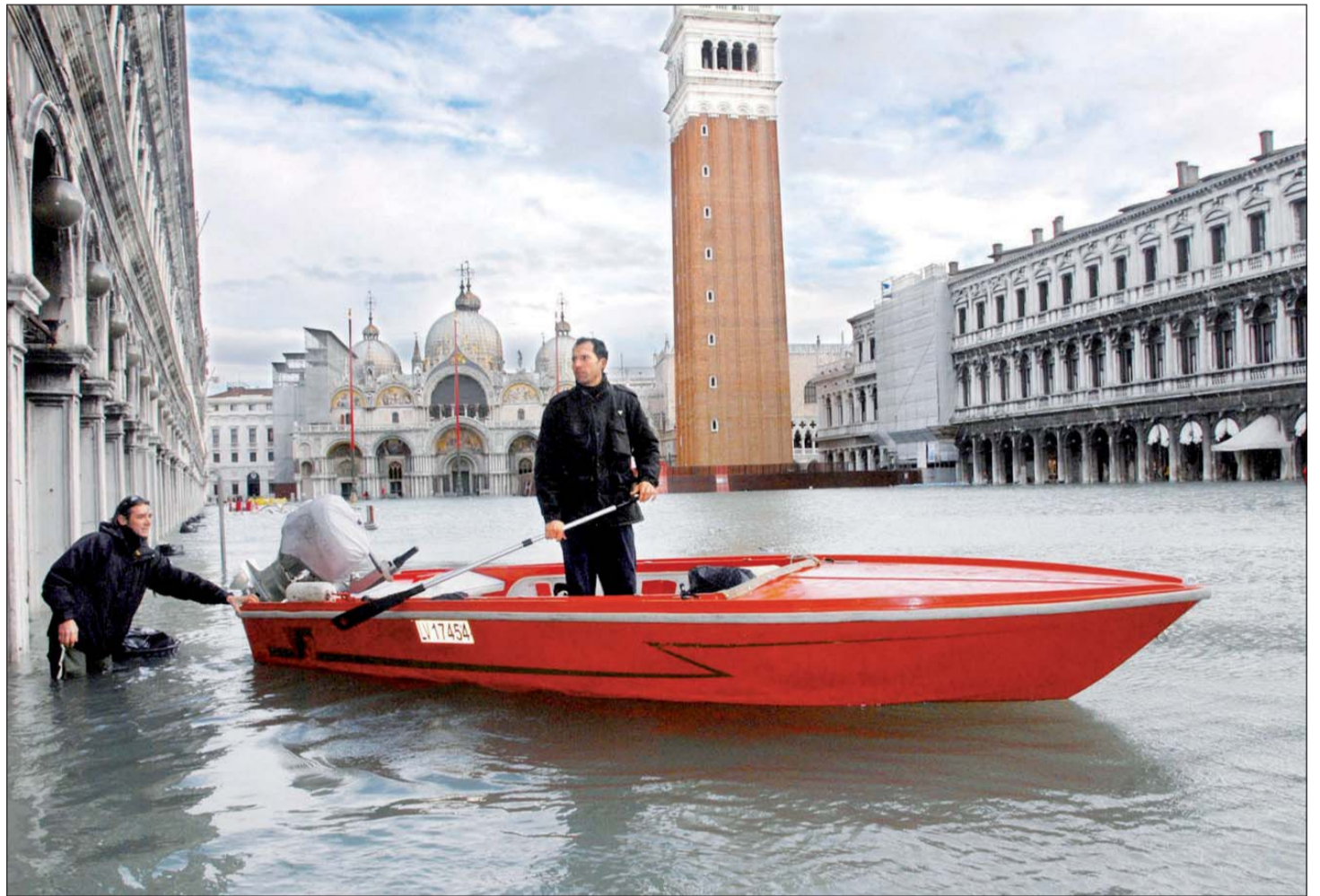
Las intensas lluvias y la crecida del mar Adriático –casi 1.56 metros, algo que no se ha visto desde 1986– provocaron la inundación de casi toda la ciudad italiana. Los ferris y los servicios de taxis acuáticos en los canales se suspendieron, mientras que el alcalde Massimo Cacciari pidió a los residentes que se quedaran en sus casas. Señaló que por el momento no se pedirá la declaración de desastre, ya que el temporal no ha causado muertes o derrumbe de edificios. La imagen fue tomada en la Plaza de San Marcos