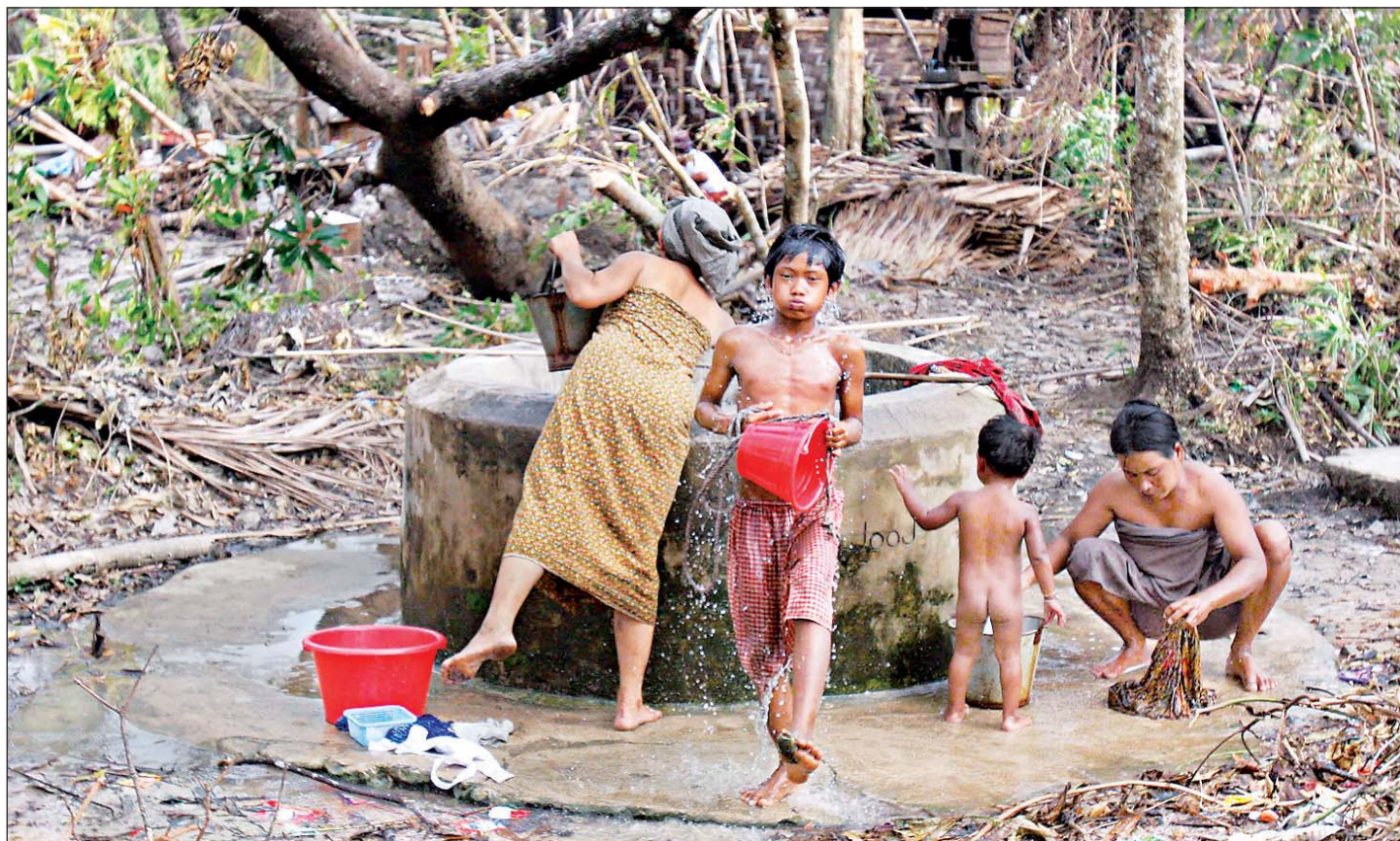
El gobierno de la antigua Birmania realizó el referendo para aprobar una nueva Constitución, con lo que ignoró los pedidos de la comunidad internacional de postergar la consulta, debido a que el país se encuentra en emergencia tras la devastación causada por el paso del ciclón Nargis. En la imagen, sobrevivientes al meteoro extraen agua de un pozo en el sur de la ciudad de Yangón