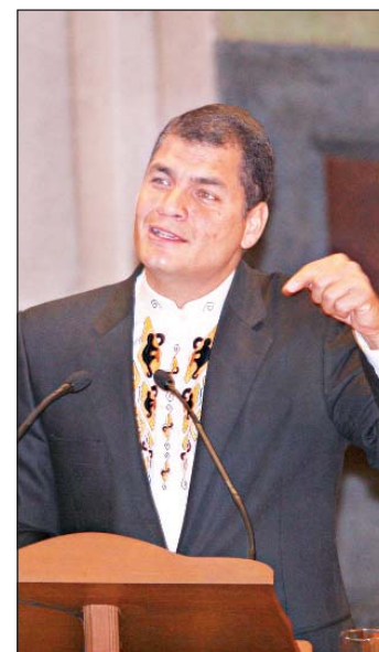
El presidente de Ecuador, Rafael Correa, en el antiguo Colegio de San Ildefonso, durante su reciente visita a México