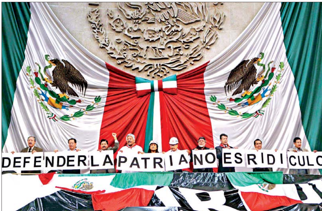
Legisladores del Frente Amplio Progresista expresaron en la Cámara de Diputados su rechazo a las declaraciones del presidente Felipe Calderón en su gira por Estados Unidos, de que la toma de las tribunas del Congreso de la Unión "pone en ridículo y empobrece al Partido de la Revolución Democrática"

■ El FAP pide tiempo y el PAN exige sancionar a "esos partidos"