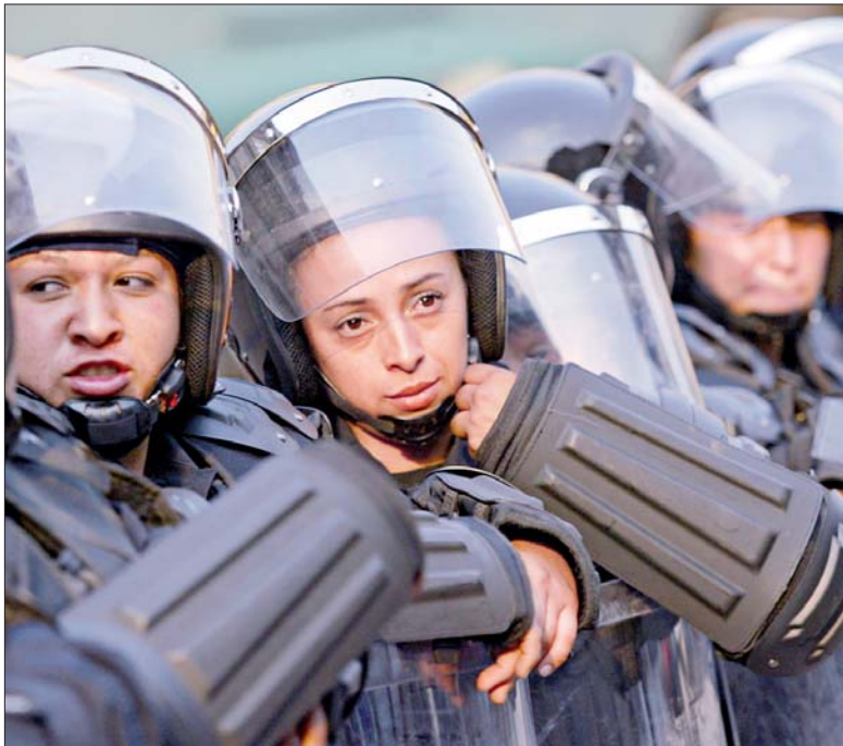
Cientos de integrantes de la Policía Federal Preventiva, incluidas mujeres, fueron desplegados para evitar que seguidores del Frente Amplio Progresista impidan que se apruebe la iniciativa de reforma energética. En el Senado se instaló un cordón de seguridad