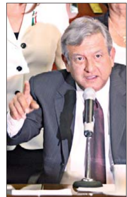
Conferencia de prensa del político tabasqueño tras su encuentro con senadores del Frente Amplio Progresista