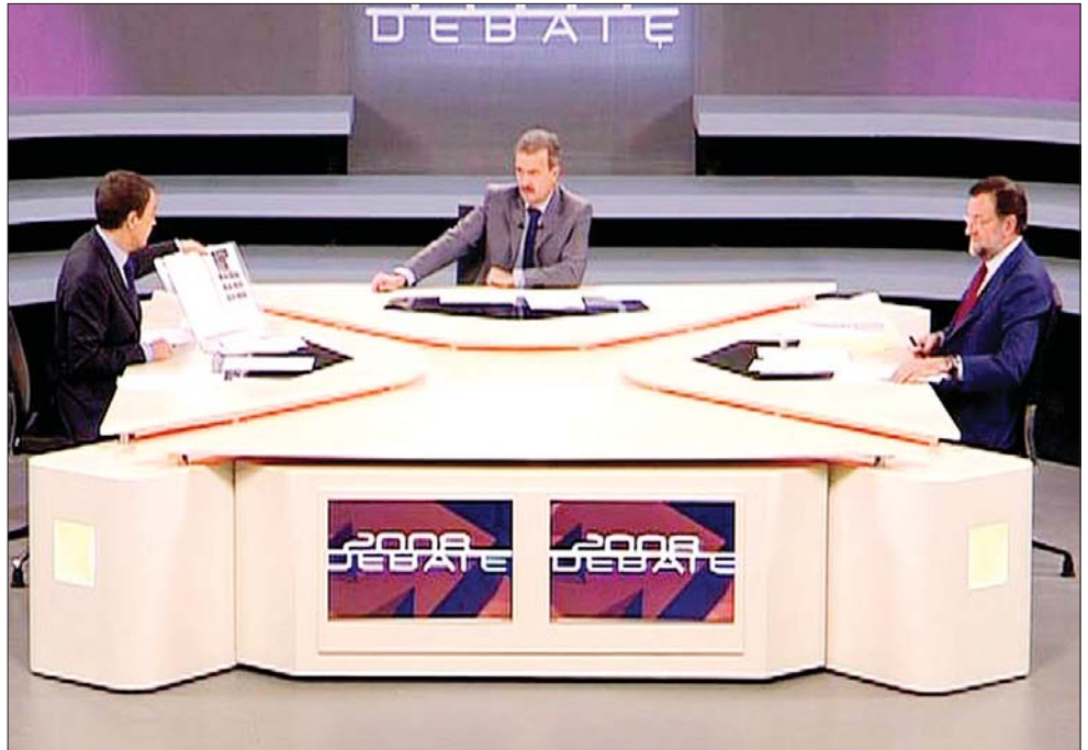
Los candidatos del Partido Socialista Obrero Español (izquierda) y del derechista Partido Popular sostuvieron ayer su primer debate televisivo de cara a las elecciones del 9 de marzo. La mayoría de las encuestas dieron como ganador al presidente de gobierno; ambos contendientes se acusaron de mentir al país. En una semana habrá una segunda vuelta, la cual podría resultar determinante en los comicios, ya que, según sondeos, 30 por ciento de los electores están indecisos