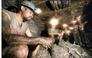
La revolución de los caracoles Rebecca Solnit

Suplemento mensual. Número 130. Febrero de 2008