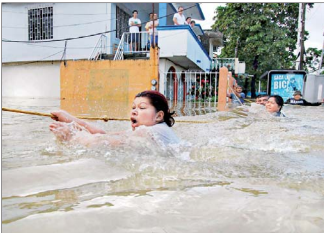
Una mujer utiliza una cuerda como guía para cruzar la calle en Villahermosa, que sufre los efectos de las peores inundaciones en 50 años. "Esta noche la ciudad se va a pique", dijo ayer con temor uno de los damnificados por el desastre