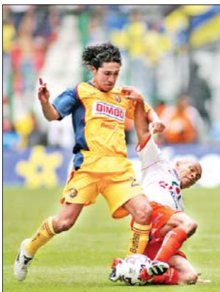
Las Águilas vaporearon 6-1 a los Jaguares de Chiapas en su presentación como locales en el estadio Azteca. El técnico Luis Fernando Tena tomó con tranquilidad el resultado y dijo que no va a echar "las campanas al vuelo", porque falta mucho por corregir