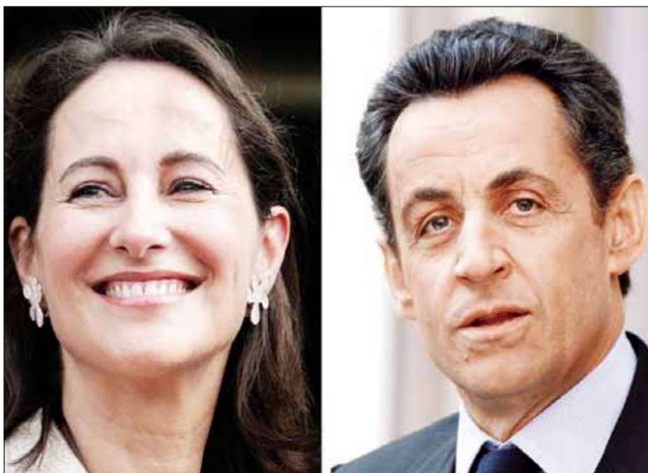
Los candidatos socialista Segolene Royal y el derechista Nicolas Sarkozy