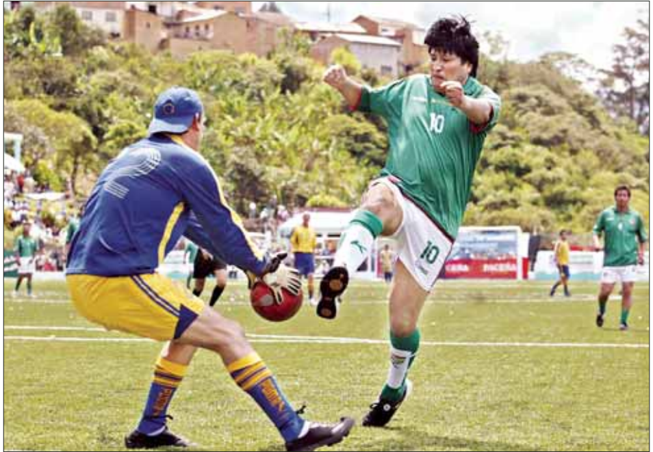
El presidente boliviano es atajado durante un encuentro amistoso realizado luego de la ceremonia de inauguración de un campo de futbol en la localidad de Coripata, La Paz