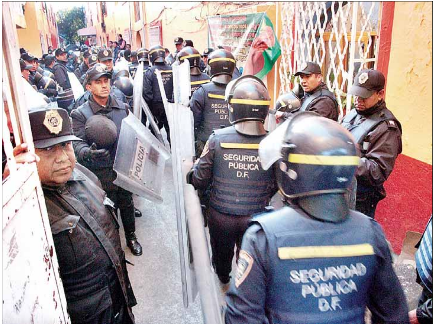
La Secretaría de Seguridad Pública del Distrito Federal realizó una recuperación parcial del predio expropiado, que se ubica entre Jesús Carranza 33 y Tenochtitlán 40; en ese espacio todavía hay 70 viviendas ocupadas. Sólo 31 familias aceptaron abandonar sus departamentos, mientras que el resto se resistió; la policía se replegó para evitar confrontaciones. Marcelo Ebrard, jefe de Gobierno capitalino, dijo que la medida permitió abatir la distribución de droga en la ciudad