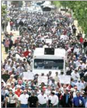
Cientos de mineros marcharon por la vía Sahagún-Pachuca en apoyo a su dirigente Napoleón Gómez Urrutia, quien fue desconocido por la Secretaría de Trabajo