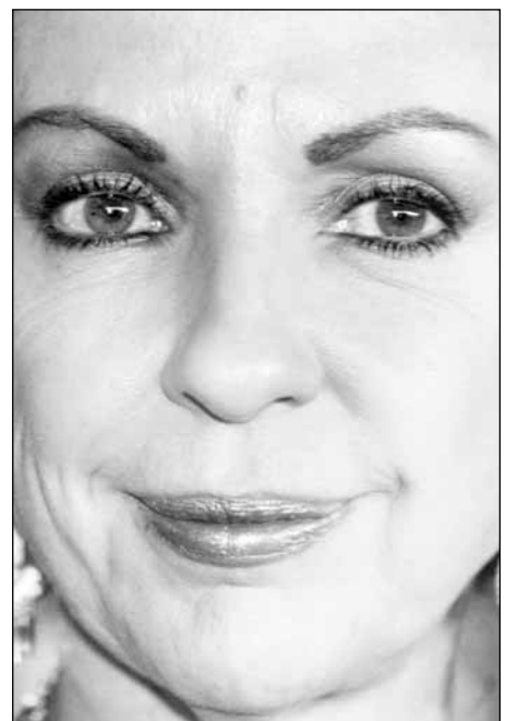
Emilio Gamboa, senador del PRI, y Marta Sahagún, esposa del Presidente