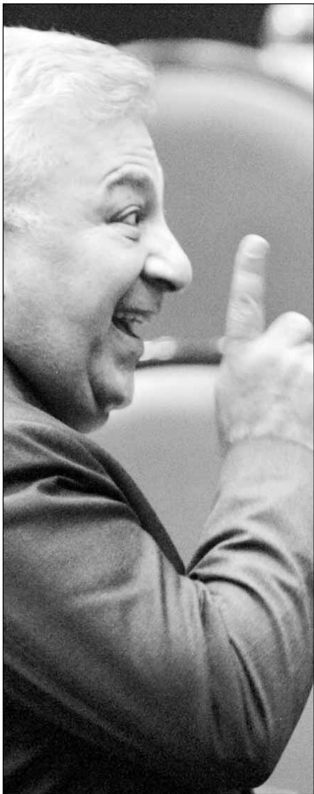
Emilio Chuayffet, diputado y coordinador legislativo del PRI