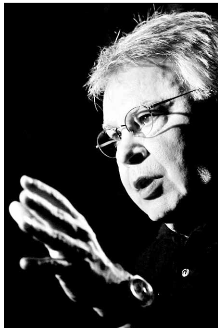
Felipe González, ex líder del PSOE

Agregó: "Ese mismo partido que en su momento puso en marcha los GAL ahora quiere poner en marcha un proceso de negociación con ETA, que es lo dramático".