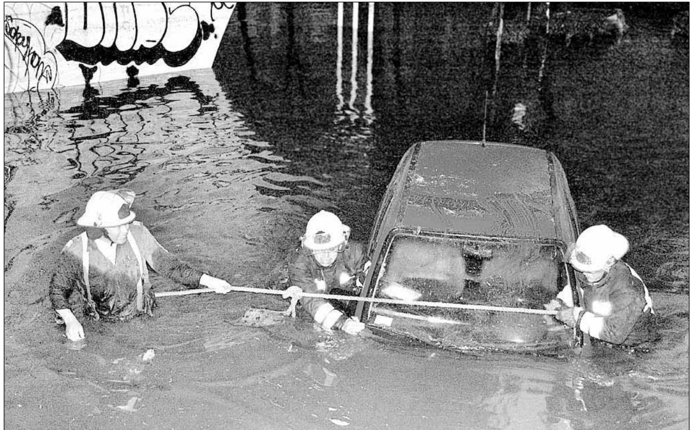
El más intenso aguacero del año desató un caos vial en el poniente, centro y sur del DF. En la imagen, la anegación entre Viaducto y Periférico