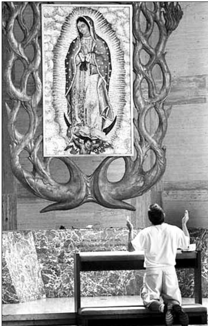
Oraciones y devoción ayer en la catedral de San Francisco, en EU