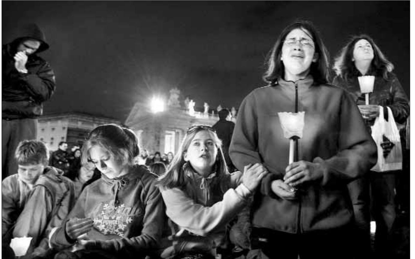
Unas 30 mil personas participaron en un rosario dedicado al Papa en la plaza vaticana de San Pedro, mientras el líder religioso sigue grave