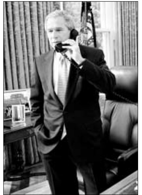
George W. Bush recibe en la Casa Blanca la llamada de John Kerry