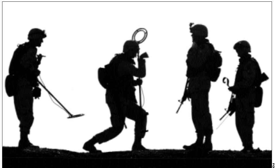
Un equipo militar estadounidense rastreador de minas se prepara a partir en Ramadi, Irak

"Han estado leyendo al aire las entrevistas, y haciendo comentarios o..."